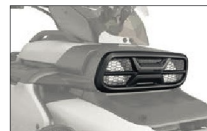
1 Захист фари (219401171)