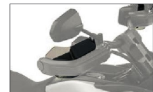
2 Щиток для захисту рук (219401186)