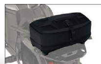
5 Спортивна сумка з системою LinQ (860202447)

Вибирайте з більш ніж 40 предметів допоміжного обладнання й аксесуарів, щоб задовольнити всі ваші потреби для наступної подорожі! Системи LinQ із точками кріплення LinQ Nano, LinQ Lite та LinQ 16" для легкого, універсального та надійного оснащення Can-Am Canyon допоміжним обладнанням та аксесуарами.